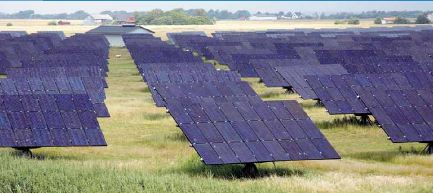
Grüne Technologie im hohen Norden Deutschlands: Bürgersolarpark Rodenäs mit mehr als 700 Solarbaugruppen.

Die NORD-Lösung hat funktionale und energetische Vorteile gegenüber Antriebsvarianten, bei denen mechanisch eingegriffen werden muss, um gegen den Wind ein Verdrehen der Solarelemente zu verhindern. Zudem profitieren die Betreiber von den geringen Unterhaltskosten der Antriebslösungen.