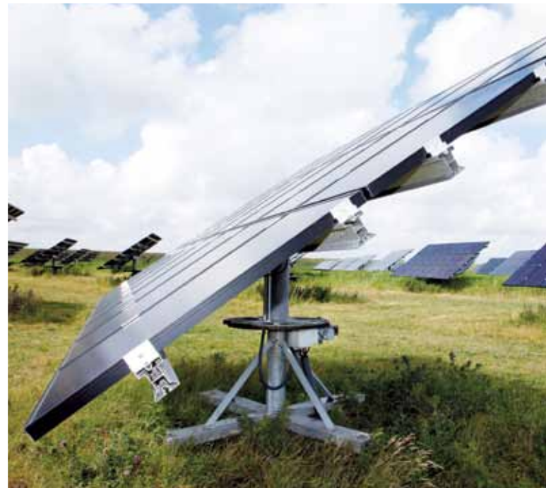
Drehgelagerte Solarbaugruppe – Antrieb geben wetterbeständige Leichtgewichte, Universal-Schneckengetriebe von NORD DRIVESYSTEMS.